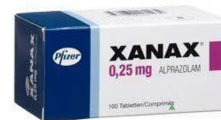
Figura 1: Fármacos Hipnóticos

Estos fármacos hipnóticos y sedativos mayormente son prescritos por los médicos profesionales, los mismos deben habilitados para la prescripción, es importante tener en cuenta que el consumo excesivo puede repercutir en una adicción a las mismas y a la vez a una tolerancia donde el paciente requerirá un aumento de dosis para conseguir un efecto en la terapéutica.